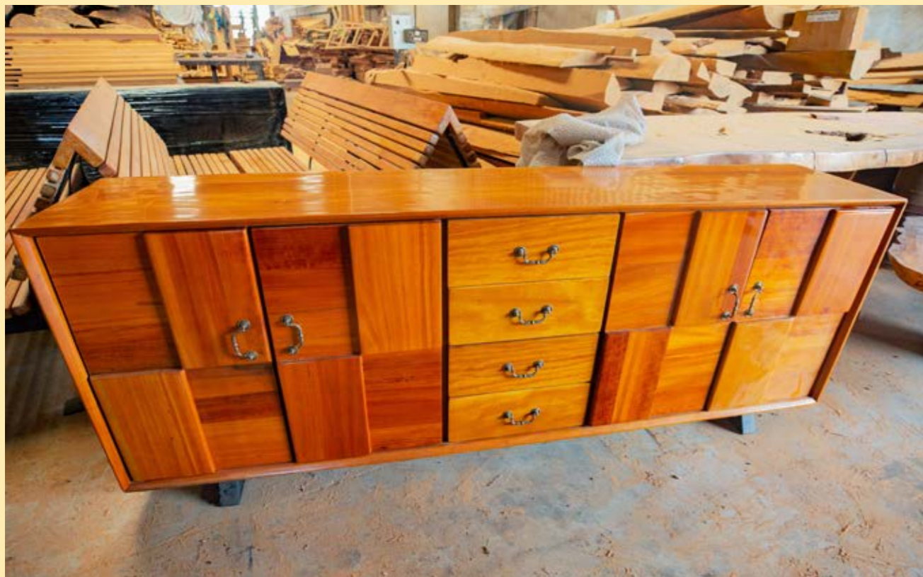
加蓬经济特区制造的产品。

随着国内木材消费量的急剧增加、近年来中国的木材进口已经呈现出极大的多样化特征。对外林业投资和贸易规模的扩大、特别是在环境和政治上脆弱的非洲与南美洲发展中国家投资、增加了供应链管理的复杂性。因此、对中国来说、制定并实施强有力的标准、支持全球