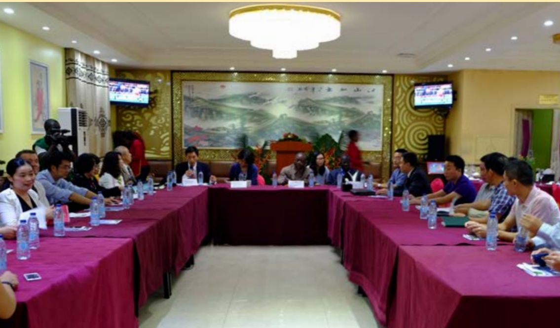
中资企业代表、加蓬林业官员、InFIT项目组成员在一起开会。

2016年进行的外部评估结果表明、InFIT一期项目取得了重要的研究成果。根据这些研究成果、中国的脚步与其他国际努力更加的协调一致、进而共同打击非法采伐、阻止毁林。但是、希望通过中国木材合法性验证体系、林产品贸易与投资国家创新联盟、投资指南等方式