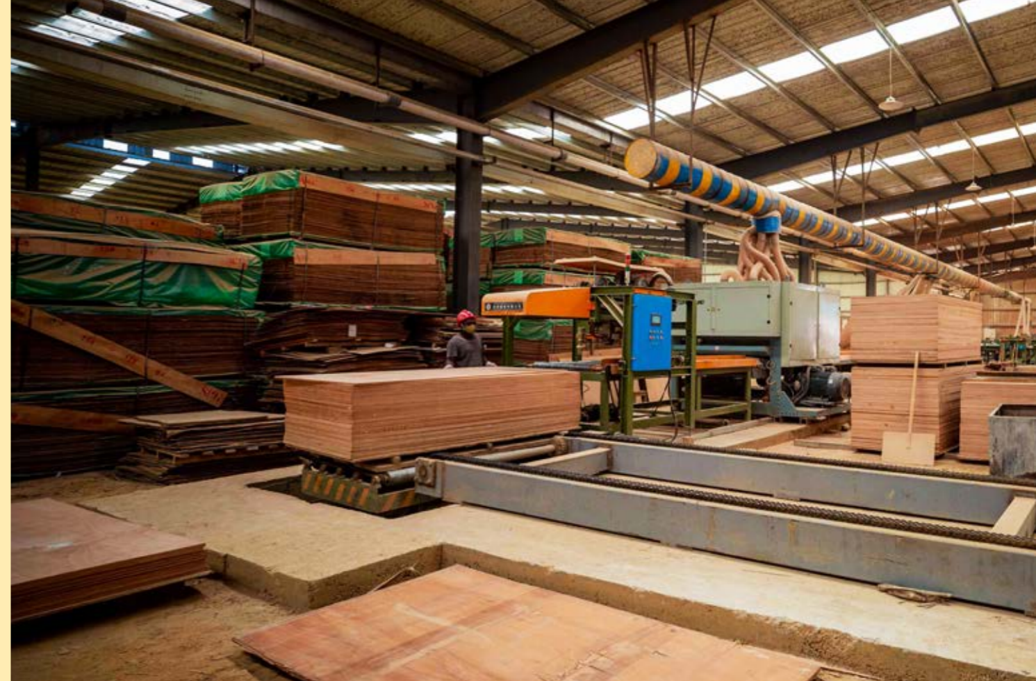
加蓬经济特区中的锯木厂。